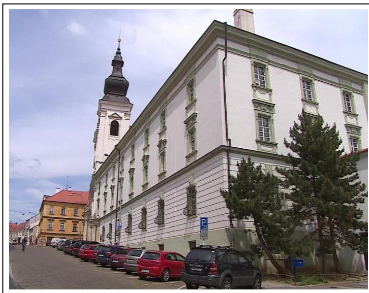
Klášterní objekt na Dolní české

Klášter je jen o něco mladší než město Znojmo