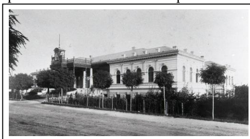
Někdejší Brantstrasse nevypadá jako dlážděná.