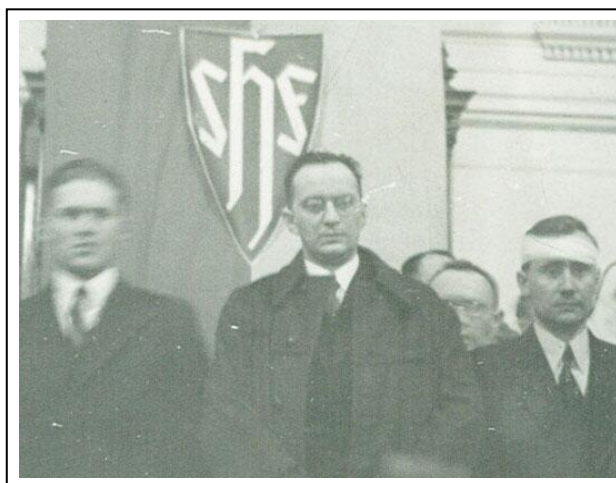
Konrád Henlein (uprostřed) v kruhu svých nejvěrnějších, jenž ho bránili i za cenu vlastního zranění