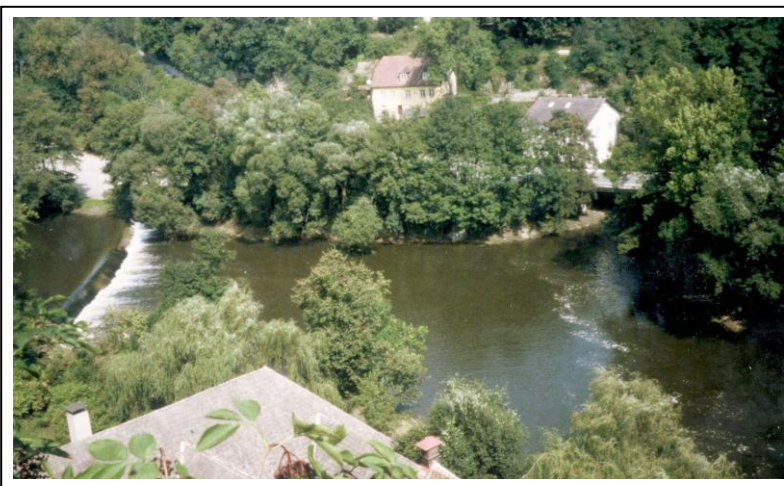
Soutok dvou Dyjí pod hradem Raabs. Zleva přes splav přitéká Deutsche Thaya, z pravé horní strany snímku se napojuje Mährische Thaya