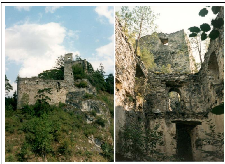
Pozůstatky hradu Eibenstein

Od hradu Kollmitz řeka Thaya pospíchá dál, kroutí se kolem skal, které by rovněž mohly být vhodnými místy pro strážní hrady, teče podél úzkých říčních niv, kde se její šum po léta mísil s klapotem mlýnů. Teprve tam, kde se strmý lem řeky rozestupuje v širší údolí, stojí další z podyjských hradů – Eibenstein – vlastně pouze jeho torzo. Však má také za sebou více než osm století. První zmínka o hradu pochází z roku 1194, kdy byli majiteli panství bratři Riwin a Leopold de Iwenstein z Perneggu. Původně se hrad jmenoval Iwenstein, česky Ivanov. Následným majitelem byl rod Babenbergů. Zajímavý je pro nás rok 1278, kdy se zde zastavil při cestě na Moravské pole český král Přemysl Otakar II. Na přelomu 13. a 14. století panství vlastnil rod z Maissau. Panstvo ale na hradě nebydlelo. Roku 1660 byla nemovitost prodána hrabatům von Sprinzenstein, ale to už rozpadající hrad sloužil za základnu lapkům.