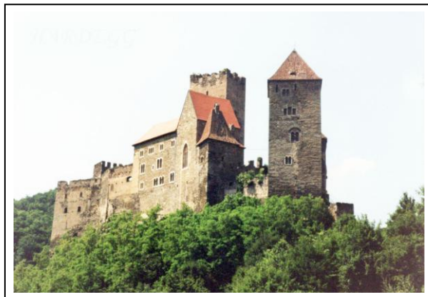
Hrad Hardegg, pohled od jihovýchodu

Jméno Hardegg náleží nejmenšímu rakouskému městečku a současně největšímu hradu našeho jižního souseda. Zatímco městečko sotva se stovkou stálých obyvatel leží při soutoku potoka Fugnitz s Dyjí, hrad se ve své mohutnosti vypíná na skalním ostrohu, odkud střeží od 12. století obchodní cestu z Dolních Rakous na západní Moravu. Původně se jednalo jen o malou tvrz, které vládla hrabata z Plainu a Hardeggu. Když jejich rod vymřel, střídali se ve vlastnictví hradu četní majitelé, kteří posléze už statnou pevnost dále rozšiřovali. Přibyla věž, palác a kaple. Na konci 15. století hrad vlastnili Habsburkové, následně bratři Püschenkové, svobodní páni ze Stettenbergu, takto stolníci štýrského vévodství. V polovině 17. století přešel hrad do držení rodu Khevenhüller-Mensch. Po třicetileté válce hrad chátral a po zemětřesení v roce 1754 a po velkém požáru 1764 dali vlastníci svolení, aby si lidé z městečka rozebírali kamenné zdivo pro vlastní potřebu.