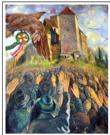
Inkriminovaný obraz z Hardeggu