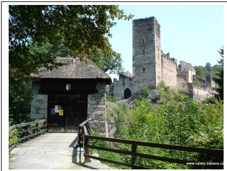
Vstup do hradu Chýje

Strmá skála nad hlubokým údolím potoka, zvýšená ještě mohutnou hradební zdí, mu skýtala přirozenou ochranu. Na cestě do hradu pak nepřátelům znemožňovaly přístup dva zdvihací mosty přes příkopy a věže se spouštěcí mříží. Proč vlastně šlechta opevňovala svá sídla i v mírových časech? Řečeno dnešní terminologií, doba byla politicky velmi nestabilní. Mnohý malicherný spor mezi sousedy se řešil lokální válkou v podobě ozbrojeného výpadu, zapálením hradu protivníka a rychlým ústupem za vlastní hradby, neboť odplata na sebe nenechala dlouho čekat. A pak některé hrady byly základnou loupeživých rytířů, kteří plenili okolní panství. Hrad Kaja byl za vlády pánů z Lipé na konci 14. století jedním z nich.