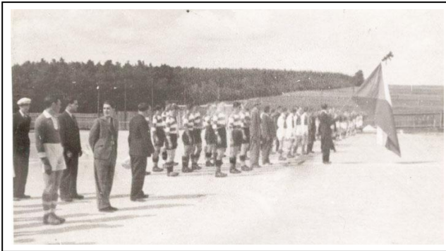
Nástup účastníků fotbalového turnaje na Desce

V západní části cvičebního prostoru, směrem ke škole byl na počest desátého výročí vzniku Československé republiky vybudován v roce 1928 Jubilejní park (viz snímek vpravo). V dalších letech byl park rozšířen na celý prostor původního hřiště.