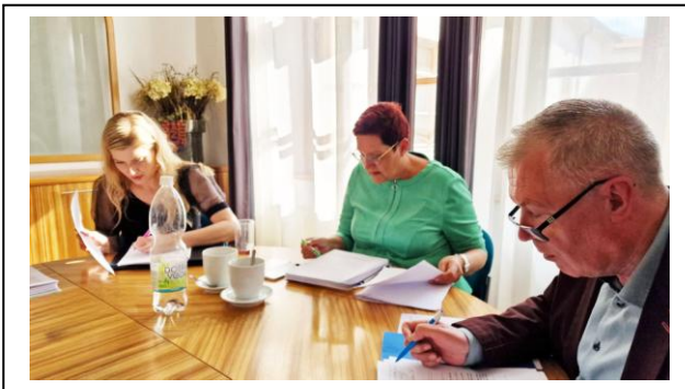
Jedná se, jedná...