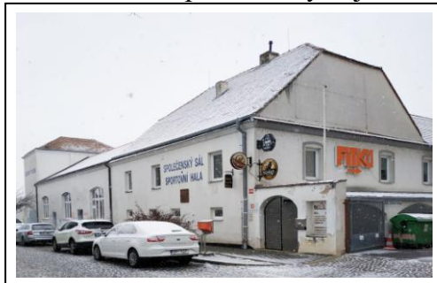
Znojemský Lidák v současnosti

Zásadně se proměnilo i využití Lidáku. Restaurační činnost se přesunula do separátní pivnice Vyschlá dáseň na místo bývalých garáží a vnitřní sály se přeměnily na jedno velké fit centrum. Dá se říct, že vše lepší, než aby objekt zel prázdnotou.